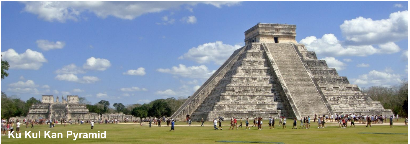
Ku Kul Kan Pyramid